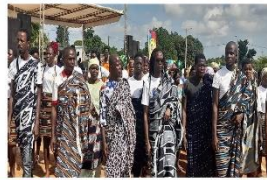
Festival des Arts et Traditions d'Akan (FATA) : Une clôture mémorable à Sakassou